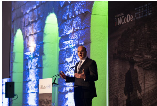
Pedro Siza Vieira apresentou o Plano de Ação para a Transição Digital há um ano. Octavio Passos

Entre 3 e 6 de maio (segunda a quinta-feira da próxima semana) os principais marcos do processo de transição digital em Portugal, as consequências da pandemia e o muito que ainda está por fazer neste campo, estarão em discussão num evento do Portugal Digital e INCoDe 2030 com transmissão online (leia para conhecer os oradores de cada dia) e que conta com o apoio do Expresso