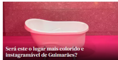
Será este o lugar mais colorido e instagramável de Guimarães?