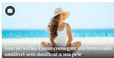
Tom de verão. Como conseguir um bronzeado saudável sem danificar a sua pele.