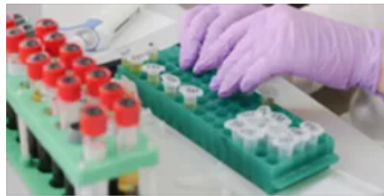
N.N. - Atualidade Hemofilia: uma vida como as outras