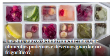
Uns sim, outros definitivamente não. Que alimentos podemos e devemos guardar no frigorífico?