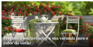
Prepare o seu terraço e a sua varanda para o calor do verão