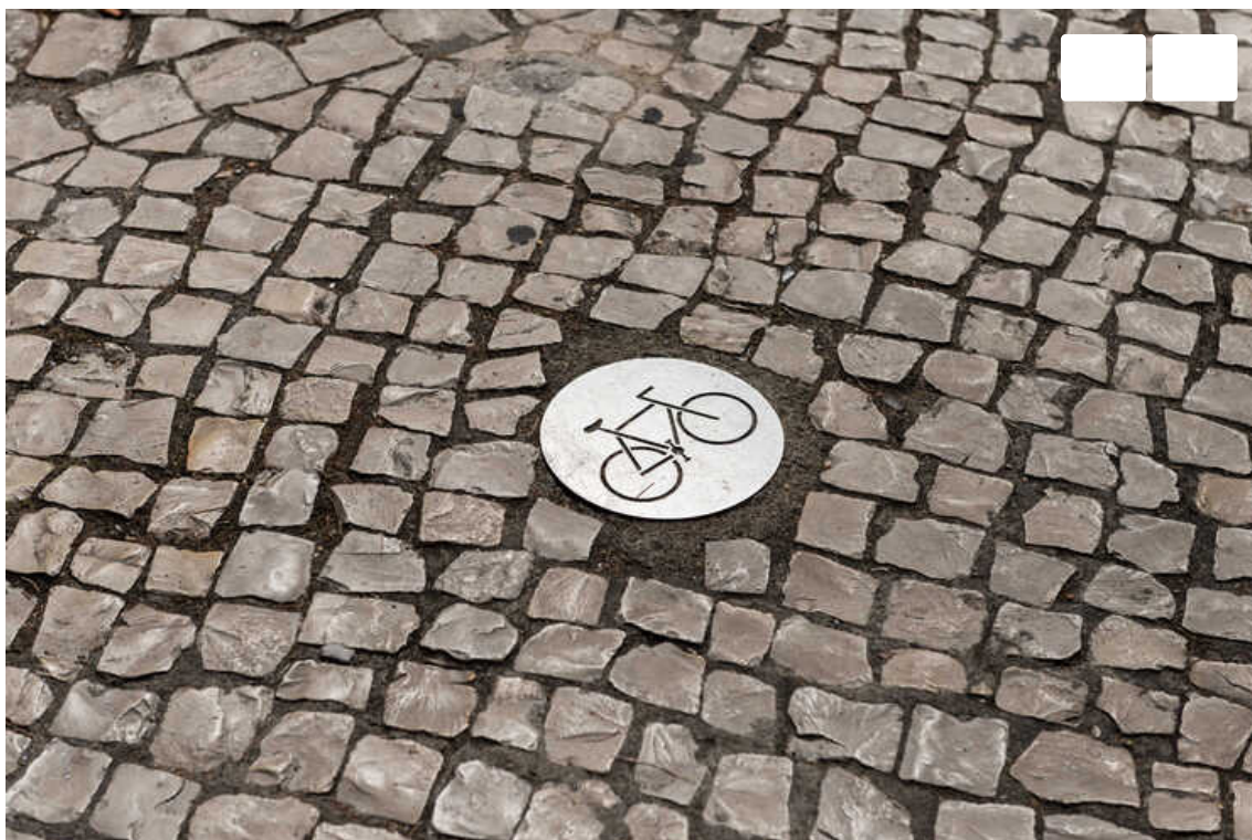
Ciclovia fragmentada, em Lisboa